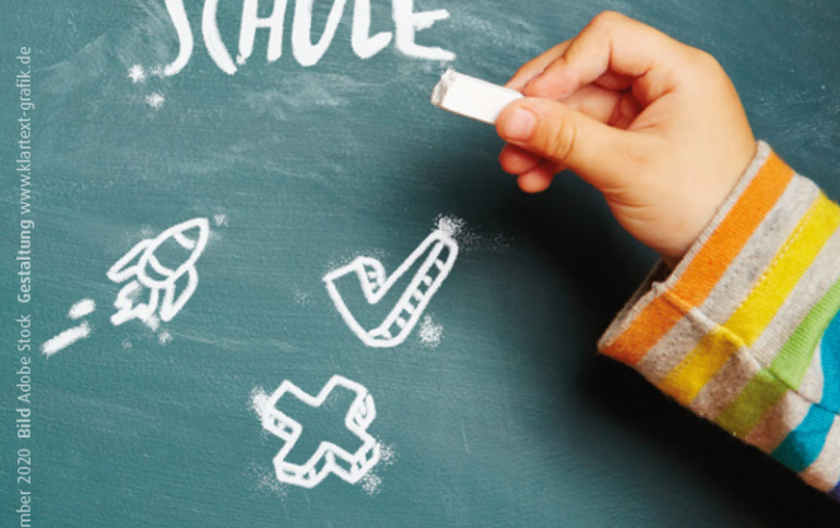
Stand November 2020 Gestaltung www.kartentext-grafik.de

Herausgeberinnen Stadt Osnabrück Der Oberbürgermeister Fachbereich Bildung, Schule und Sport Postfach 4460 49025 Osnabrück